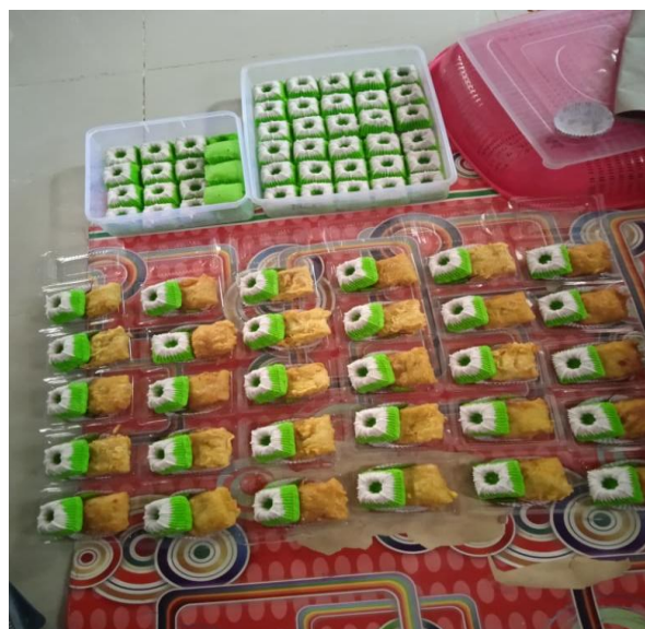
Gambar 3. Gambar Hasil Foto Produk