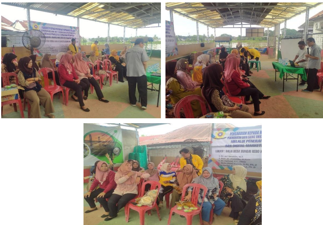
Gambar 2. Pelaksanaan kegiatan PkM

Pelaksanaan program pengabdian masyarakat yang berfokus pada peningkatan daya saing UMKM di Desa Sungai Rebo, Kecamatan Banyuasin I, melalui penerapan teknologi informasi dan digital marketing menghasilkan sejumlah capaian yang terukur dan berdampak langsung terhadap peningkatan kemampuan pelaku UMKM dalam memanfaatkan teknologi digital untuk kegiatan promosi dan pemasaran. Program ini diikuti oleh 20 pelaku UMKM dari berbagai sektor usaha seperti kuliner, kerajinan, pertanian olahan, dan jasa rumahan, dengan tingkat partisipasi aktif mencapai 87,5%. Berikut foto-foto kegiatan pelatihan: