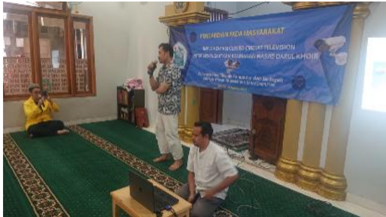
Gambar 2. Proses sosialisasi pelatihan penggunaan alat

Berdasarkan hasil evaluasi melalui observasi dan wawancara, para pengurus menunjukkan peningkatan kemampuan teknis yang signifikan. Mereka telah mampu melakukan pemantauan, pencarian rekaman, serta pemeliharaan sistem secara mandiri tanpa ketergantungan kepada tim teknis.