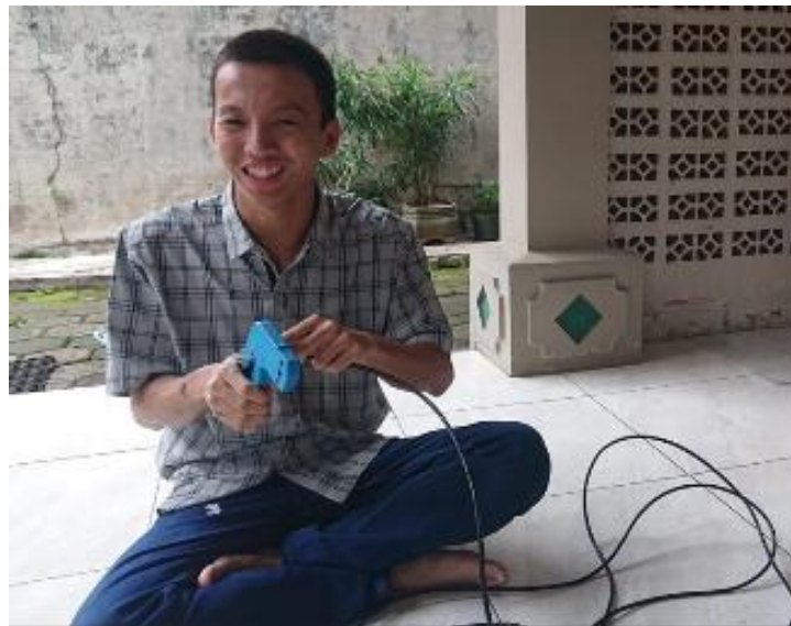
Gambar 3. Proses perakitan dan pengujian alat

Berdasarkan hasil evaluasi melalui observasi dan wawancara, para pengurus menunjukkan peningkatan kemampuan teknis yang signifikan. Mereka telah mampu melakukan pemantauan, pencarian rekaman, serta pemeliharaan sistem secara mandiri tanpa ketergantungan kepada tim teknis.