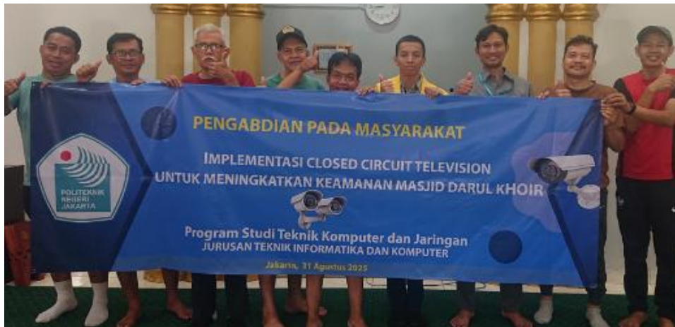
Gambar 4. Proses penyerahan dan sosialisasi alat

masyarakat akan pentingnya pengelolaan masjid yang profesional, transparan, dan berbasis teknologi. Kondisi ini sejalan dengan tujuan pengabdian kepada masyarakat, yaitu mendorong pemberdayaan umat melalui pemanfaatan teknologi yang tepat guna dan berkelanjutan.