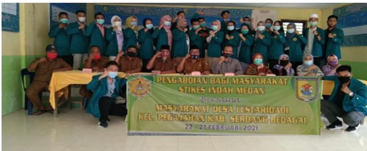
Gambar 3. Tim PKM dan Perangkat Desa Lestari Dadi, Serdang Bedagai

Gambaran investasi alat pembuatan Minyak Gosok Sahe Mila ( Tabel 1 ) murah dan terjangkau oleh Ibu PKK Desa Lestari Dadi Serdang Bedagai. Bahkan sebagian telah tersedia di dapur masing-masing, seperti: pisau, penyaring, gunting, tampah, sendok pengaduk dan ember, karena memang harus disediakan sebagai alat wajib di dapur yang biasa digunakan sehari-hari. Ini menggambarkan bahwa Ibu PKK Desa Lestari Dadi Serdang Bedagai tinggal menyediakan pengemas produk. Pengemas berupa botol kaca yang didesain sedemikian rupa hingga tidak merepotkan Ibu PKK tersebut.