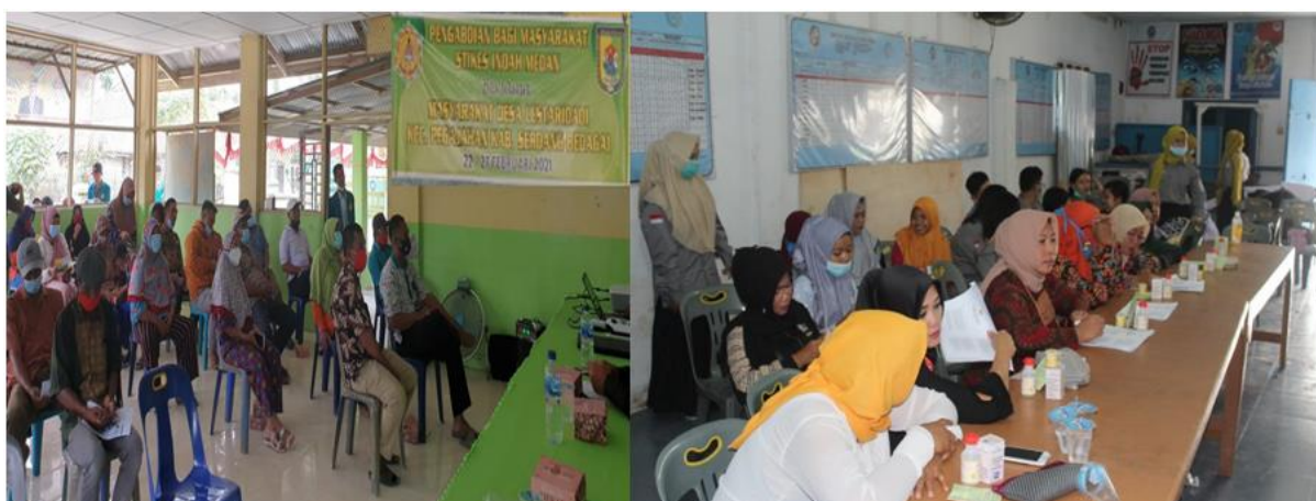
Gambar 6. Ibu PKK Desa Lestari Dadi Ikuti Pelatihan Pembuatan Minyak Gosok Sahe Mila