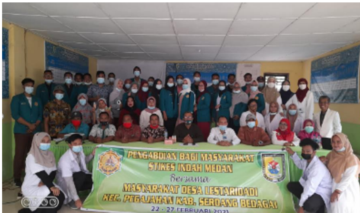
Gambar 4. Tim PKM Pembuatan Minyak Gosok Sahe Mila

Gambar 4 sampai Gambar 6 menampilkan suasana Pendampingan Pembuatan Minyak Gosok Sahe Mila. Pendampingan dari awal hingga pengemasan produk. Tampak bahwa pendampingan diliputi suasana keakraban dan keikhlasan Ibu PKK Desa Lestari Dadi, Serdang Bedagai.