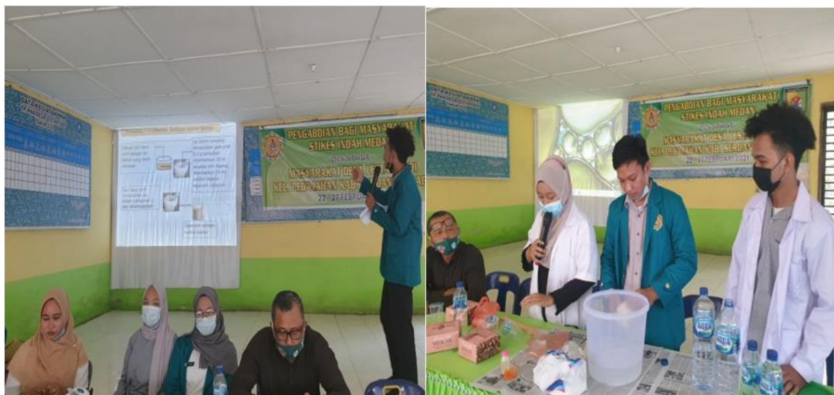
Gambar 5. Dosen dan mahasiswa sedang memberi pelatihan Minyak Gosok Sahe Mila