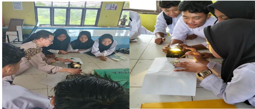
Gambar 1. Kegiatan Bimbingan Penggunaan KIT Optik kepada Siswa

fisika merupakan strategi yang relevan, efektif, dan konsisten dengan kecenderungan penelitian mutakhir di bidang pendidikan sains.